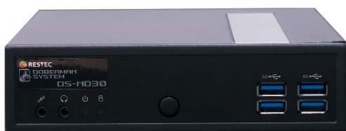
< Network Defender DS-ND30 >

ネットワーク上の未許可端末を排除する「Network Defender DS-ND30」は、無線アクセスポイントからの不正アクセス、退職者による不正アクセス、私用スマホなどのアクセスによるウイルス感染やデータの持ち出しを防止しセキュリティを向上させます。